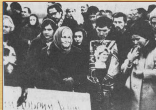
Похорон Алли Горської. 1970р. У центрі Стус з портретом художниці.

Літературна діяльність поета, його звернення у вищі партійні інстанції з протестами проти порушення людських прав і критичними оцінками тогочасного режиму спричинили арешт у січні 1972 року. Впродовж майже 9 місяців поет перебував у слідчому ізоляторі. Саме тоді було створено збірку « Час творчості ».