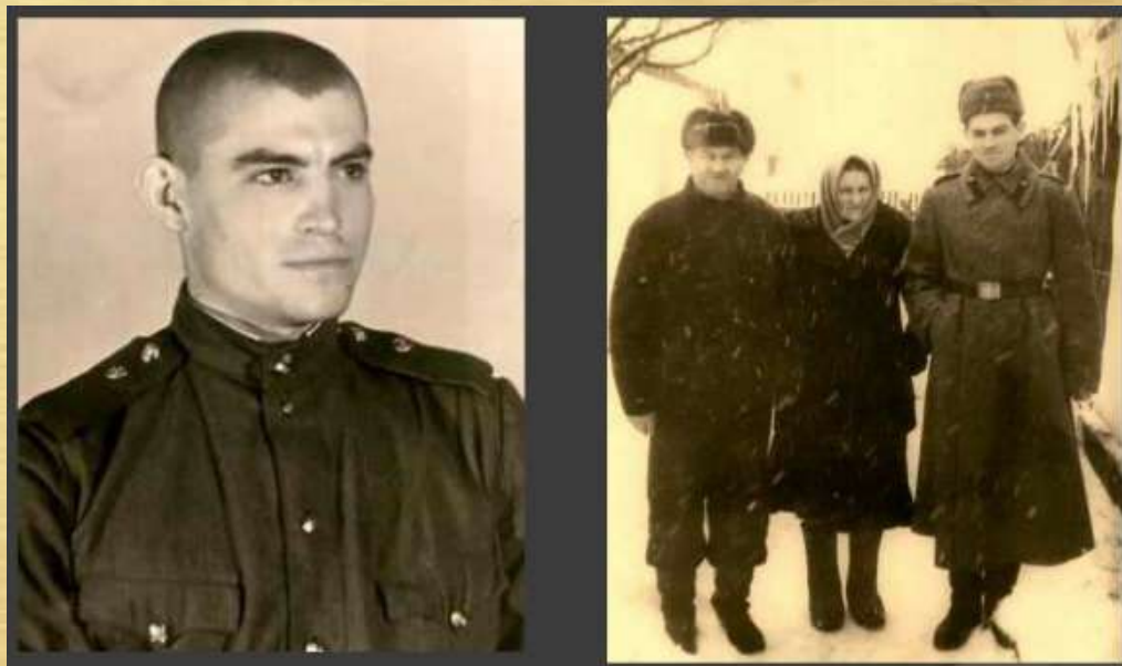
Армійські роки. 1959-1961.

Весняне Усміхаються глобусові Школярі на уроках, І сонце, Неначе глобус, Усміхається школярам, А за вікном Реве повесіння, Вантажене снігом і кригою, Ща лісом тріск іде – Нові проростають проліски.