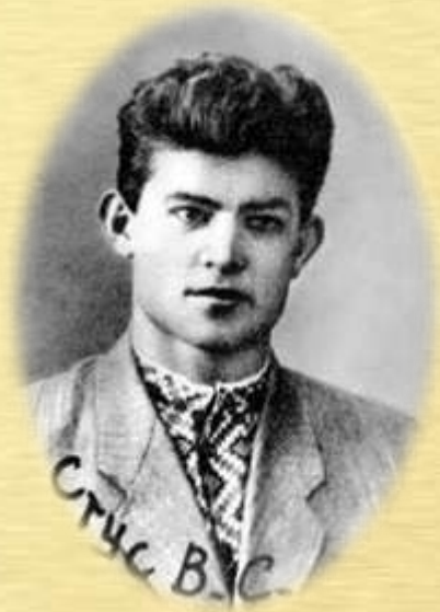
Фото з випускного альбому педінституту, 1959 р.

У 1954-1959рр. Василь навчався на історико-літературному факультеті педагогічного інституту міста Сталіно. У студентські роки був членом літературного об'єднання «Обрій».