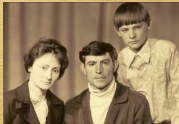
Василь з дружиною і сином