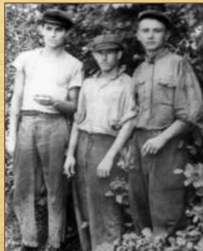
Під час роботи на залізниці. Донецьк, 1954р.