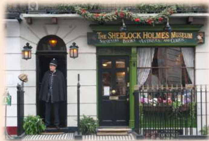
Музей Шерлока Холмса в Лондоні

❖ У 1887 році, коли світ побачила перша історія про Шерлока Холмса, будинку за адресою 221В на Бейкер-стріт не існувало. Лише в 90-х роках на цьому місці з'явився всесвітньо відомий дім детектива. І хоча музею дозволили користуватись адресою 221В Baker Street, насправді, він знаходиться між будинками під номерами 237 і 241.