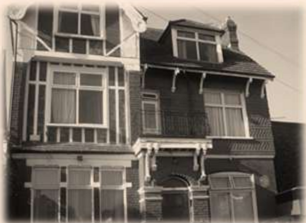
Дім письменника у Норвуді

Велику роль у його житті відіграла його мати Мері Фоулі. Від неї він успадкував свій інтерес до лицарських традицій, подвигів і пригод. Дойл казав: «Справжня любов до літератури, схильність до письменництва йде в мене, я вважаю, від матері».