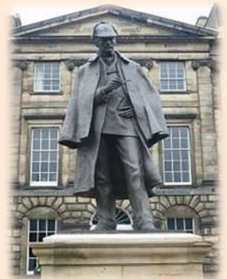
Пам'ятник Шерлоку Холмсу в Единбурзі