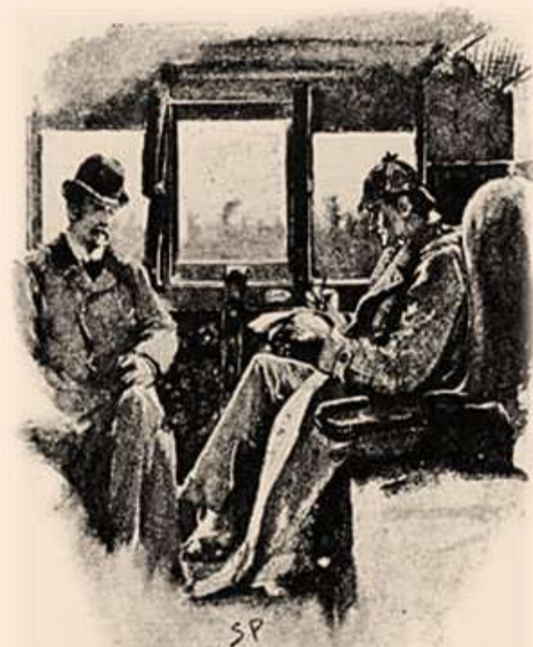
Шерлок Холмс і д-р Ватсон. Малюнок Сідні Педжета

❖ В оповіданнях про Шерлока Холмса Дойл описав багато методів криміналістики, що були ще невідомі поліції. Серед них – збір недопалків і сигаретного попелу, ідентифікація друкарських машинок, роздивляння в лупу слідів на місці події. Згодом поліцейські стали широко використовувати ці та інші методи Холмса.