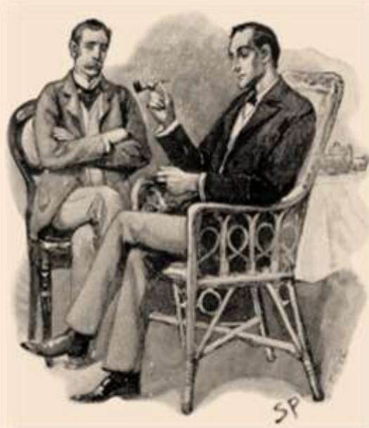
Шерлок Холмс і д-р Ватсон. Малюнок Сідні Педжета

❖ Читачі часто сприймали Шерлока Холмса не як літературного героя, а як справжнього детектива. Тому на його адресу, та й на адресу Дойля надсилалися листи з проханнями допомогти вирішити якісь проблеми чи загадки.