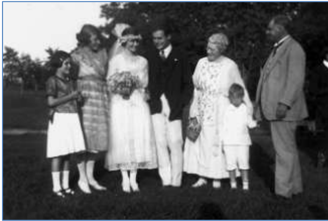
Перша дружина – Елізабет Гедлі Річардсон (1891-1979)

Хемінгвей був дуже влюбливим. Тому не дивно, що він був одружений 4 рази.