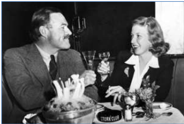
Третя дружина – Марта Геллгорн (1908-1998)