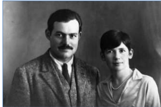
Друга дружина – Пауліна Пфайфер (1895-1951)