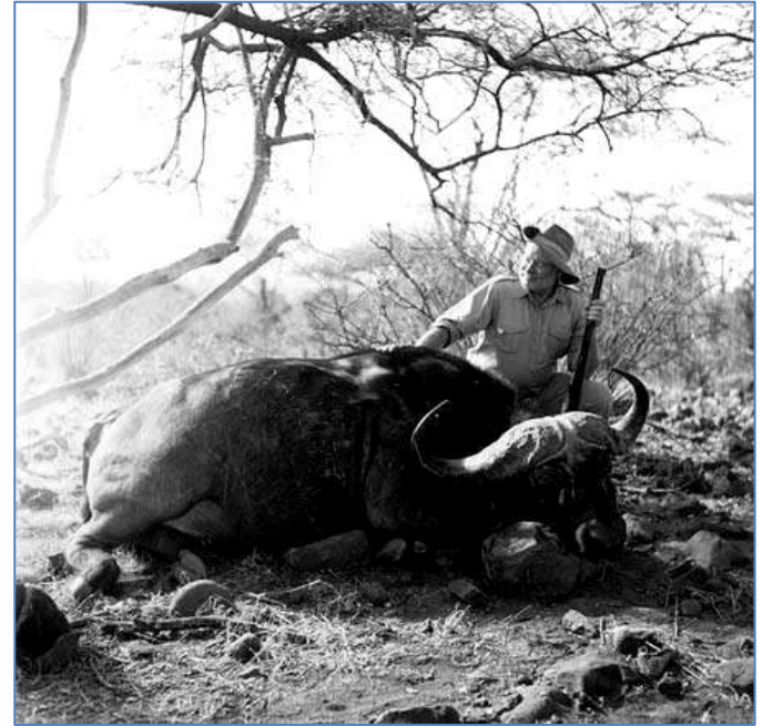
Е. Хемінгуей на сафарі в Кенії, 1953 р.