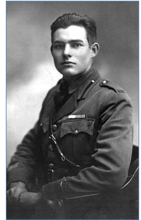
Е. Хемінгуей, 1918 р.

У шпиталі з нього витягли 28 осколків, при цьому на тілі Ернеста було більше двохсот ран.