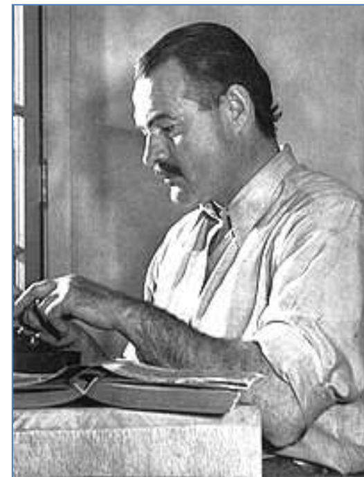
Е. Хемінгуей, 1939 р.

Він дуже переймався Громадянською війною в Іспанії середини 1930-х років. Враження від війни знайшли відбиток в іншому відомому романі – «По кому подзвін» (« For Whom The Bell Tolls », 1940). Цей роман багато критиків вважають найкращою роботою письменника.