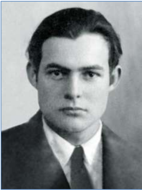
Е. Хемінгуей, 1923 р.

Літературне покликання Хемінгуея виявилось ще в шкільні роки. Після випуску із середнього навчального закладу він вирішив не вступати до університету, а переїхав до Канзасу, де працював у місцевій газеті «Star».