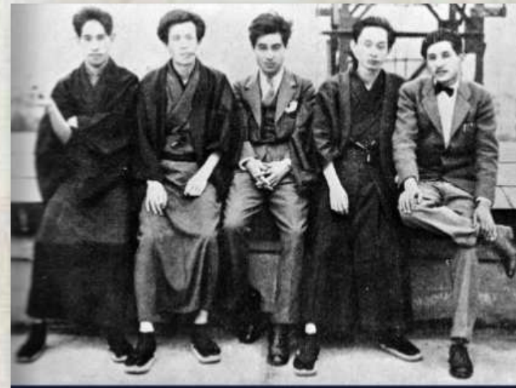
Я. Кавабата і засновники літературного журналу

Пізніше письменник зазначав: "У захопленні від літератури Заходу я намагався наслідувати кращі її зразки. Але по суті я – східна людина і ніколи не втрачав свого власного шляху" .