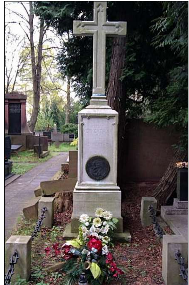
Пам'ятник на могилі лікаря

Після війни Марію Веркентін було посмертно нагороджено Офіцерським Хрестом Ордена Відродження Польщі. Її іменем названо відділення радіології в одній з лікарень, зал в Інституті радіології у Польщі. Символічну могилу вченої облаштовано на лютеранському цвинтарі у Варшаві. 2011 р. у Польщі з нагоди 110-річчя від дня народження Марії Веркентін були проведені численні пам'ятні заходи.