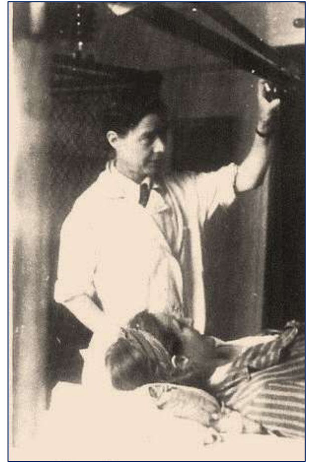
Під час роботи