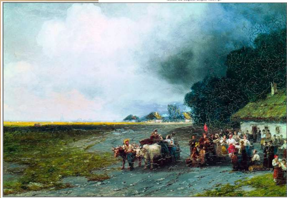
Весілля в Україні, 1892 р.