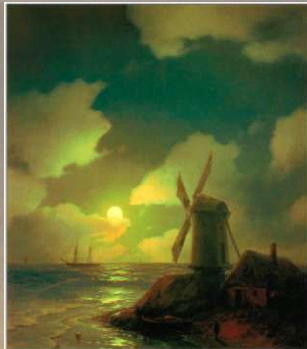
Млин на березі моря, 1851 р.

У цієї прихильності до України зіграла свою роль близькість Айвазовського до Тоголя, Шевченка.