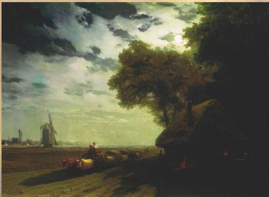
Український пейзаж з чумаками при луні, 1869 р.