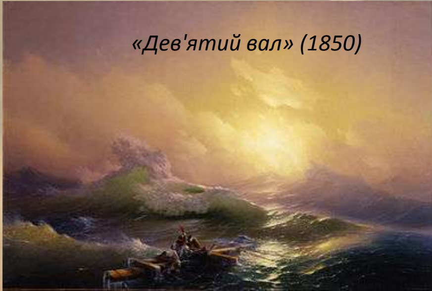
«Дев'ятий вал» (1850)