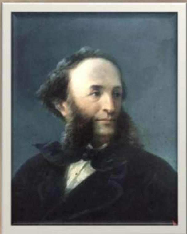
Іван Костянтинівич Айвазовський

"Море – це моє життя", – говорив І. К. Айвазовський, який і справді жагуче схилився перед об'єктом своєї любові. 29 (17 по старому стилю) липня 1817 року в книгу народжень і хрещень місцевої вірменської церкви був внесений запис про те, що народився "Ованес, син Геворга Айвазяна". Видатний український та російський художник вірменського походження, який увійшов в історію світового мистецтва як мариніст-романтик, майстер класичного пейзажу, який передає на полотні красу й силу морської стихії. Картинам Айвазовського, які найчастіше зображують море, кораблі, що борються із хвилями, властиві емоційна піднесеність, тяжіння до героїки й романтичного пафосу. За своє життя художник створив більше 6 тисяч полотен.