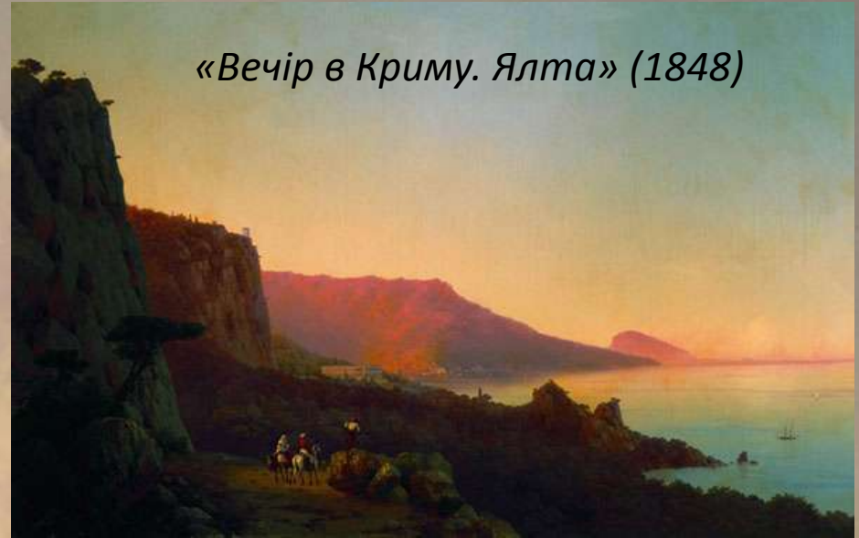
«Вечір в Криму. Ялта» (1848)