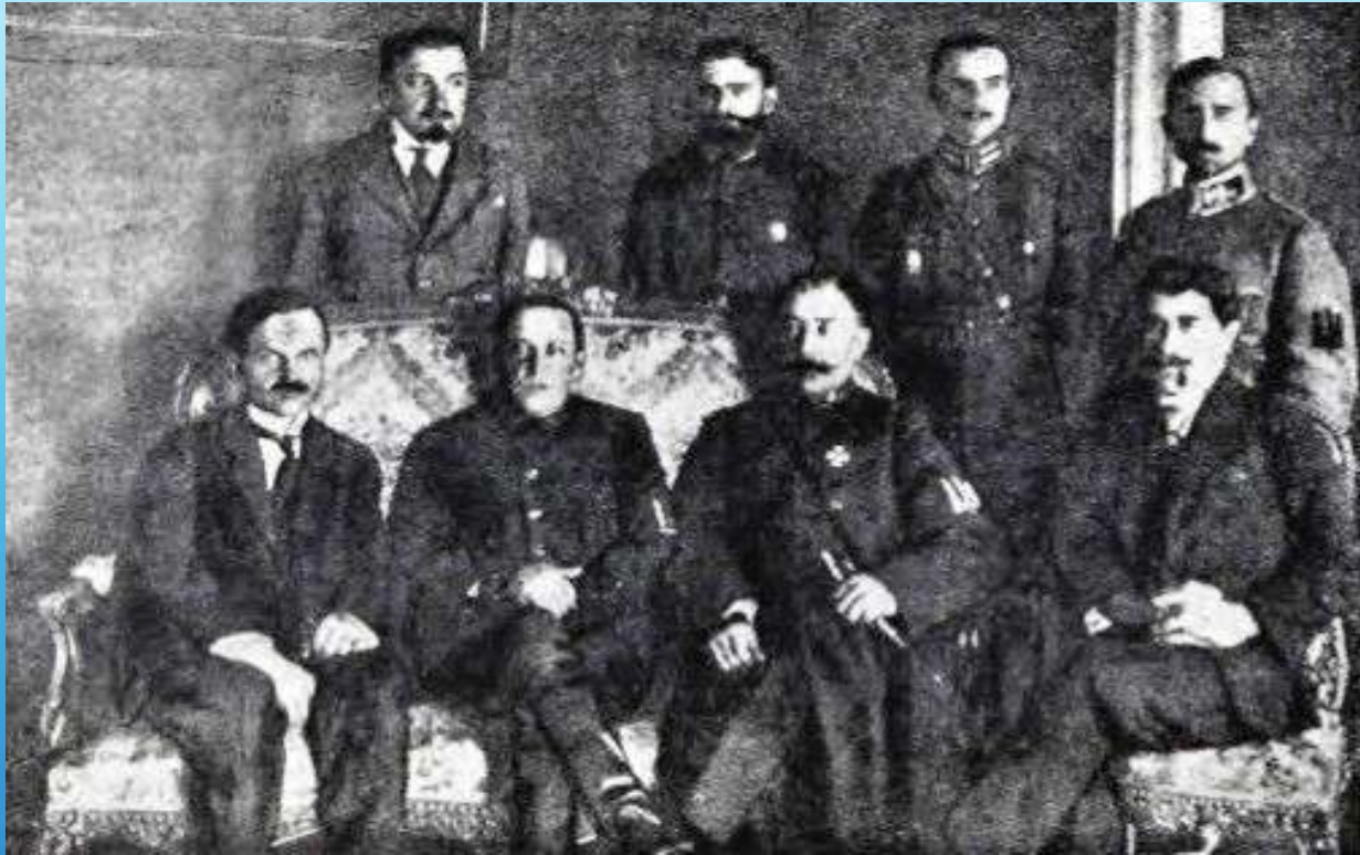
Уряд УНР, 1920 рік.

Стрімкий політичний зліт почався з травня 1917 р. – Петлюру обирають до військового генерального комітету. Він був: першим генеральним секретарем військових справ в уряді Центральної Ради, організатором Гайдамацького коша Слобідської України, головою всеукраїнського союзу земств, одним з організаторів повстання проти гетьмана П. Скоропадського, Головою Директорії УНР.