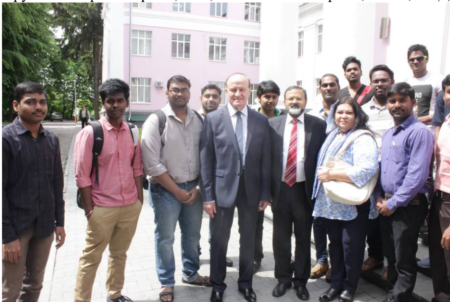
З іноземними студентами

Створені на кафедрах ВНМУ умови для одержання якісної професійної підготовки спеціалістів, особливості організації навчального процесу, стан відносин між викладачами і студентами забезпечують престижність навчання в університеті для багатьох вітчизняних та іноземних громадян. Різними формами підготовки в університеті охоплено понад 2000 іноземних громадян з 67 зарубіжних країн Європи, Азії, Латинської Америки, США, СНД.