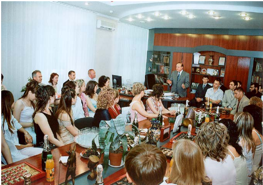
Зустріч з випускниками-відмінниками. 2006 р.