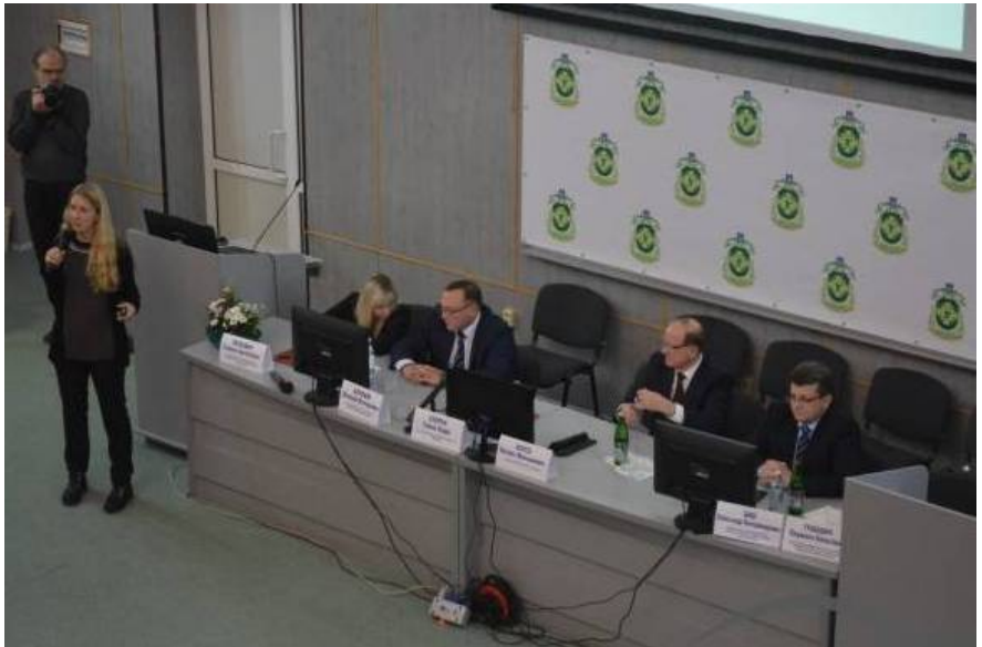
Зустріч з в. о. Міністра охорони здоров'я України У. Супрун