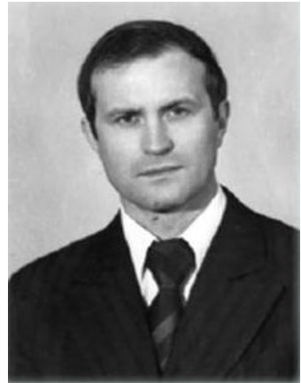
Аспірант кафедри нормальної фізіології. 1970 р.