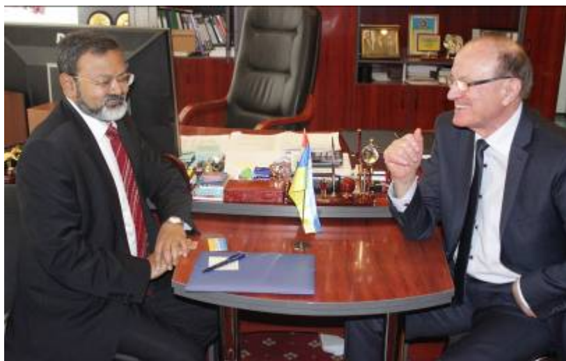
Візит Надзвичайного і Повноважного Посла Індії в Україні Манодж Кумар Бхарті