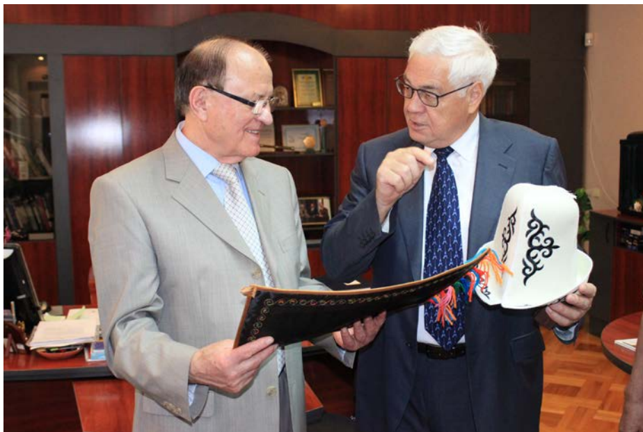
Візит Надзвичайного і Повноважного Посла Киргизької Республіки в Україні Улукбек Кожомжарович Чиналиев