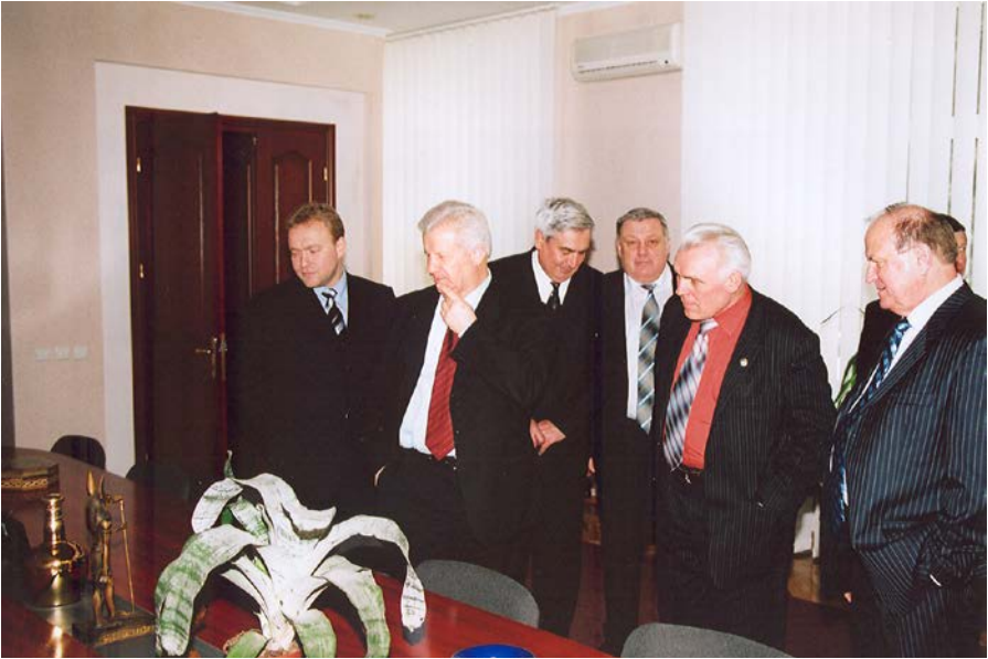
Візит Голови Верховної Ради України О. О. Мороза до університету