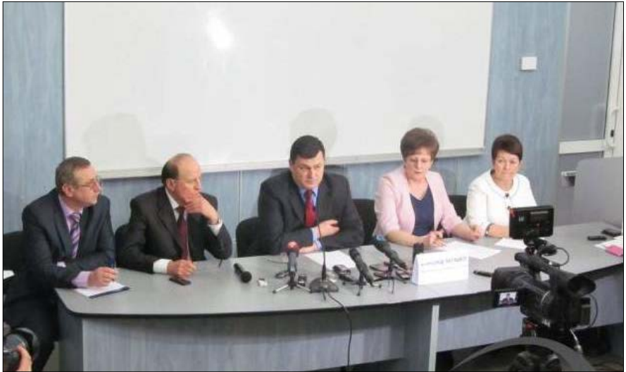
Зустріч з Міністром охорони здоров'я України О. Квіташвілі