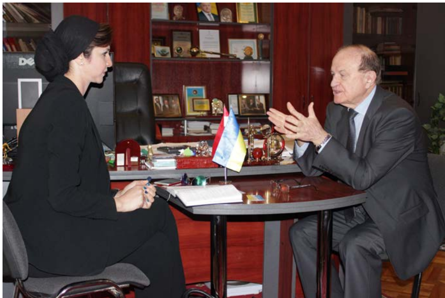
Візит консула Посольства Арабської республіки Єгипет в Україні доктор Марва Абделаал Махмуд