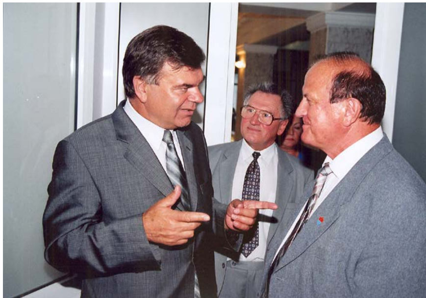
Візит Міністра освіти і науки України В. Г. Кременя