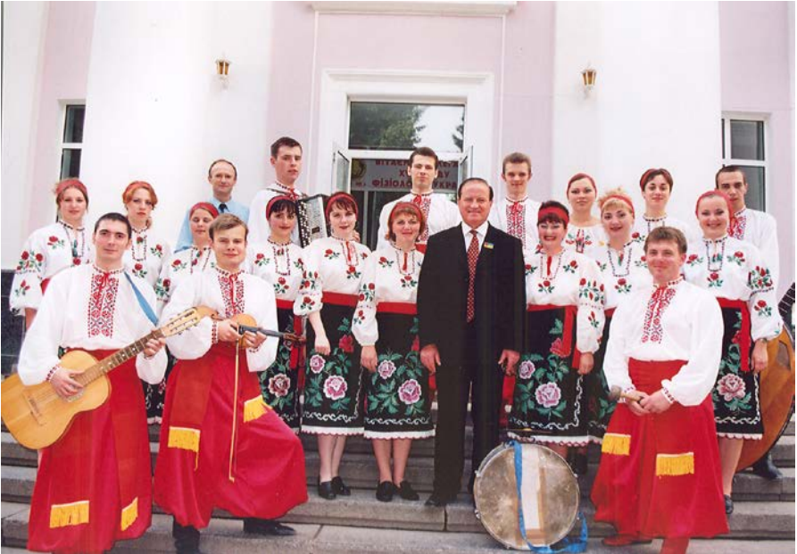
З учасниками художньої самодіяльності університету. 2006 р.