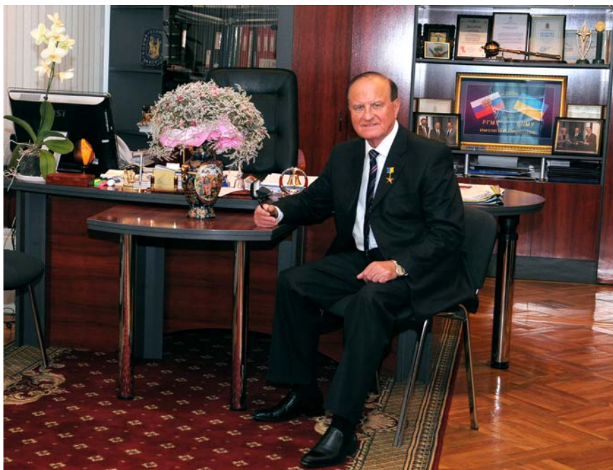
30 років на чолі Вінницького національного медичного університету імені М. І. Пирогова