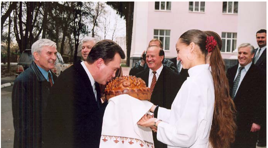
Акад. В. П. Семиноженко – шановний гість університету