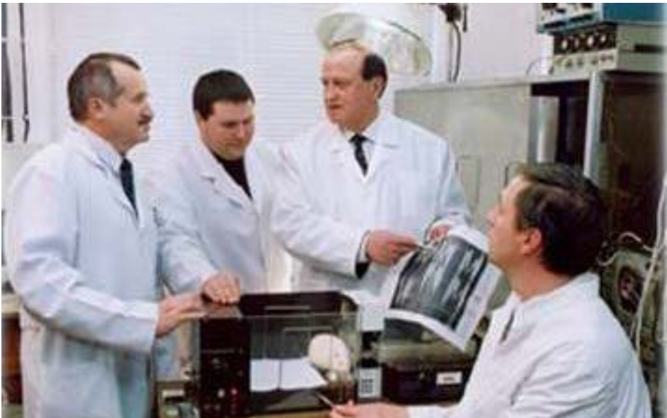
Наукова робота з учнями. 2006 р.

Завдяки зусиллям та повсякденній ректорській турботі, в