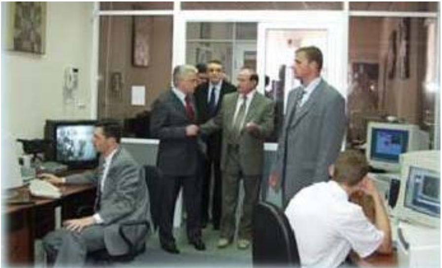
Візит Голови Верховної Ради України В. М. Литвина до університету