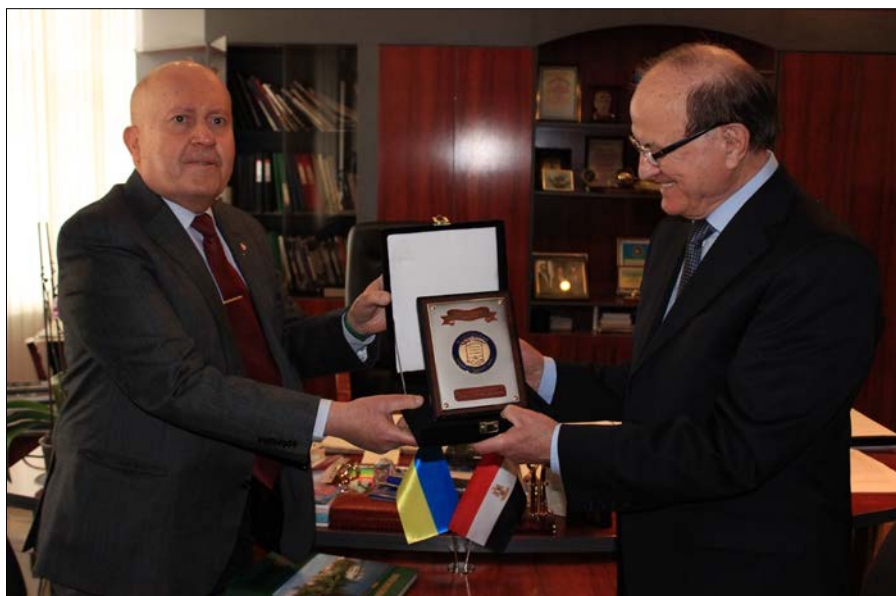
Візит Надзвичайного і Повноважного Посла Арабської республіки Єгипет в Україні Усама Тауфік Юсеф Бадр