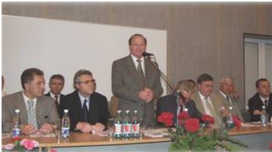
Зустріч з Президентом АМН України О. Ф. Возіановим