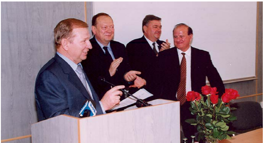
Президент України Л. Д. Кучма підписує Указ про присвоєння університету статусу національного