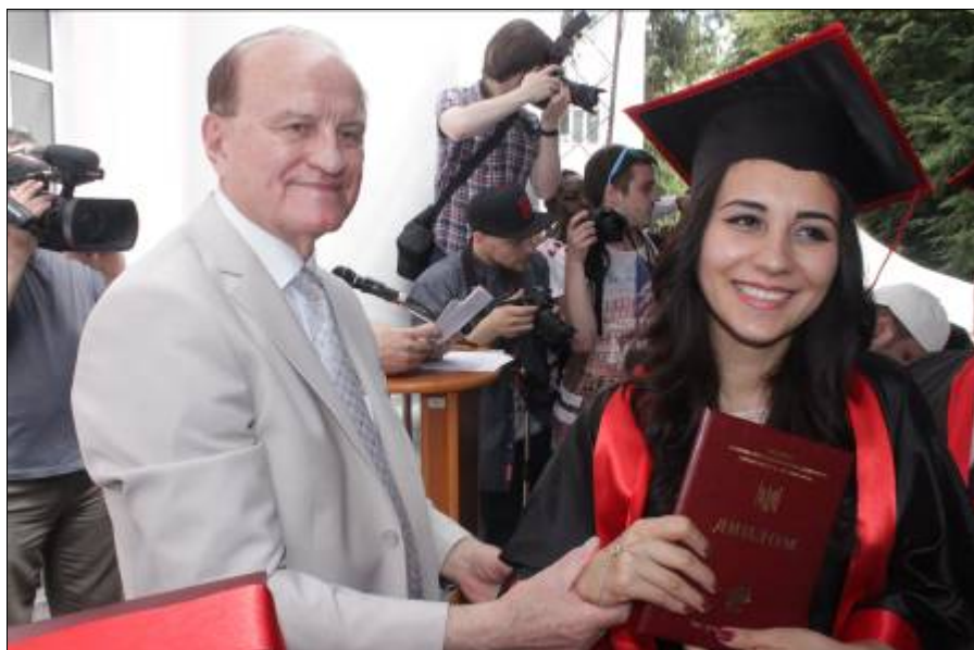
Вручення дипломів випускникам