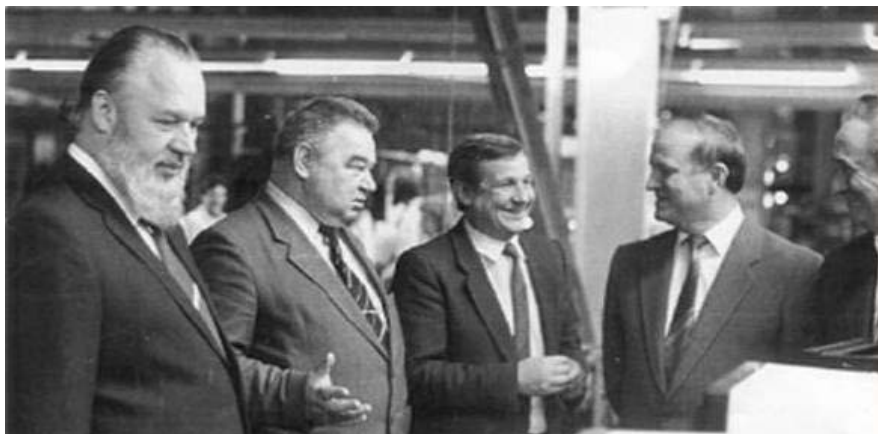
Зустріч з космонавтом Г. М. Гречко