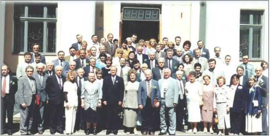
Учасники Міжнародного конгресу антропологів. Вінниця, 1998 р.

Укр. фізіол. т-ва ім. І. П. Павлова : тези доп. – Київ, 1994.