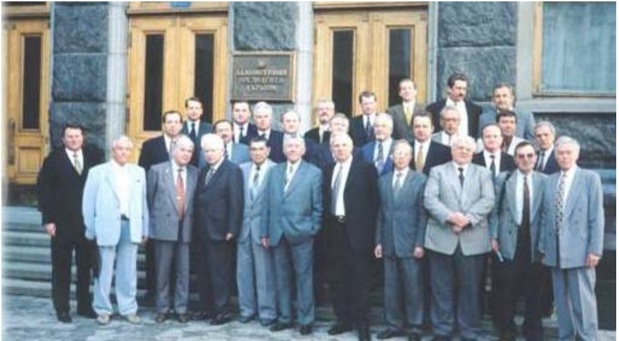
Ректори медичних ВНЗ та представники органів охорони здоров'я після зустрічі з Президентом України Л. Д. Кучмою.