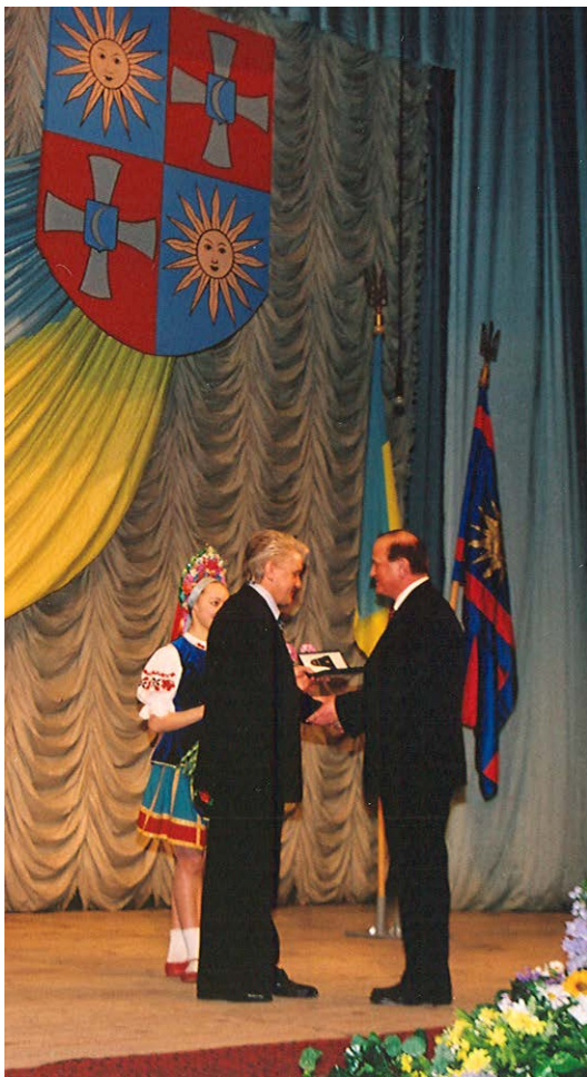
Нагороду ректору вручає Голова Верховної ради В. М. Литвин. 2012 р.

закладів, міжнародного співробітництва ВНЗ, сучасного стану вищої освіти в Україні, розвитку студентського самоврядування, працевлаштування випускників ВНЗ, залучення до навчання у ВНЗ дітей з сільської місцевості Вінниччини, пілотного варіанту реформи охорони здоров'я у Вінницькій області тощо.