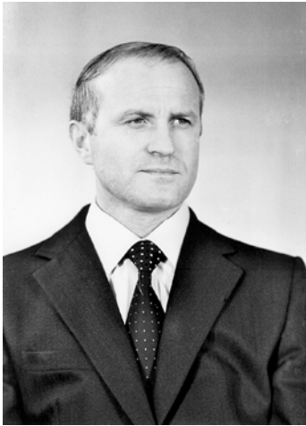
Доцент кафедри нормальної фізіології. 1976 р.