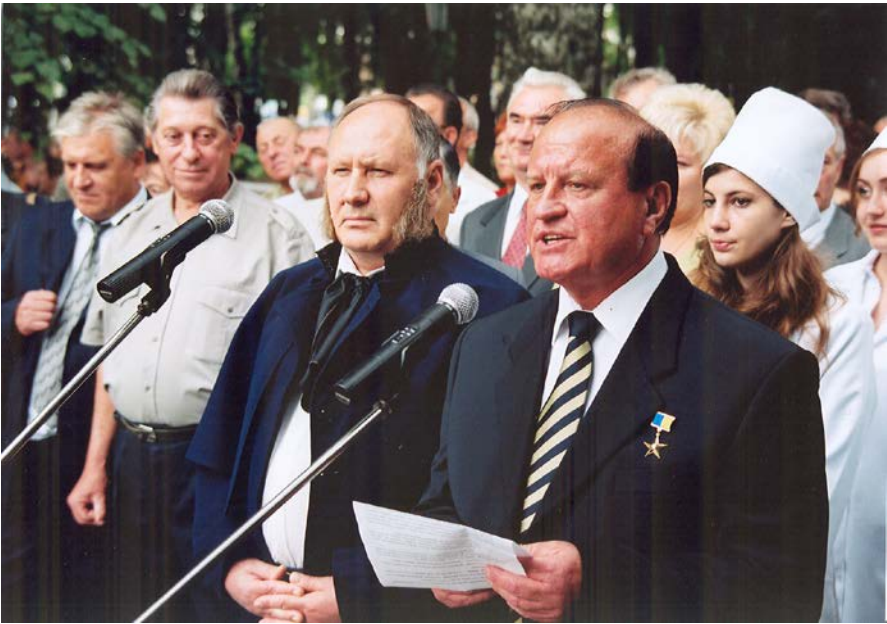
Урочиста театралізована посвята в студенти