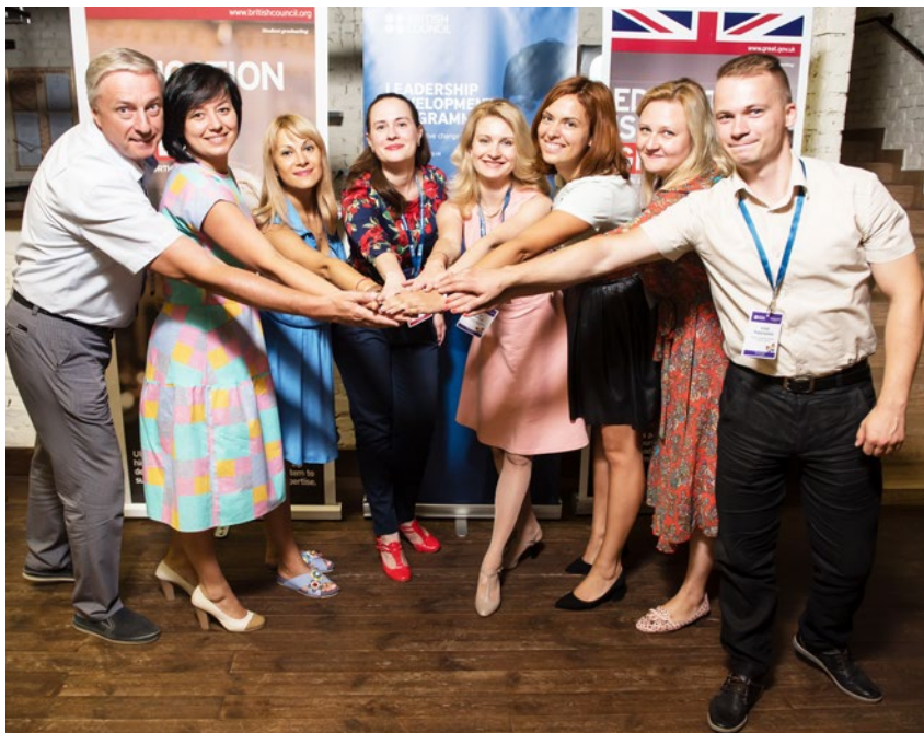
Дружня команда ВНМУ на тренінгах з лідерства від Британської Ради в Україні

Метою цього проекту є залучення ширшого кола учасників та сприяння вихованню їх лідерських якостей та проектної культури. І кроки в цьому напрямку у ВНМУ вже зроблено: створено групу з організації проектної діяльності, розроблено її річний план та триває опрацювання нормативних документів відповідно до Стратегії розвитку університету,