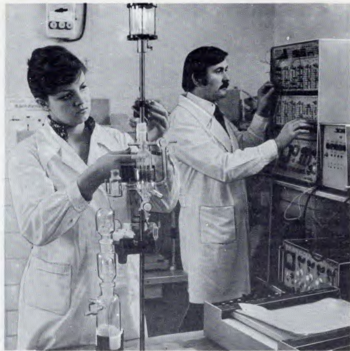
Проблемная лаборатория. Идет эксперимент.

Учебно-методическая работа неразрывно связана с идейно-воспитательной. Здесь особая роль принадлежит кафедрам общественных наук, на которых студенты изучают в течение всего периода обучения историю КПСС, политическую экономию, марксистско-ленинскую философию, научный коммунизм, этику, эстетику, научный атеизм. Должное внимание уделяется нравственному воспитанию, актуальным проблемам врачебной этики и медицинской деонтологии. В институте создан кабинет эстетического воспитания. Организация и содержание воспитательной работы непрерывно совершенствуются. Ее комплексные планы предусматривают единство идейно-политического, трудового и нравственного воспитания, направленное на формирование личности каждого студента, на выработку у него активной гражданской позиции, желания и стремления знать больше, навыков самостоятельного творчества, непримиримости к любым проявлениям буржуазной идеологии, на то, чтобы выпускники вуза несли с собой в жизнь чувство ответственности за порученное дело, преданности своему народу, Родине, Коммунистической партии.