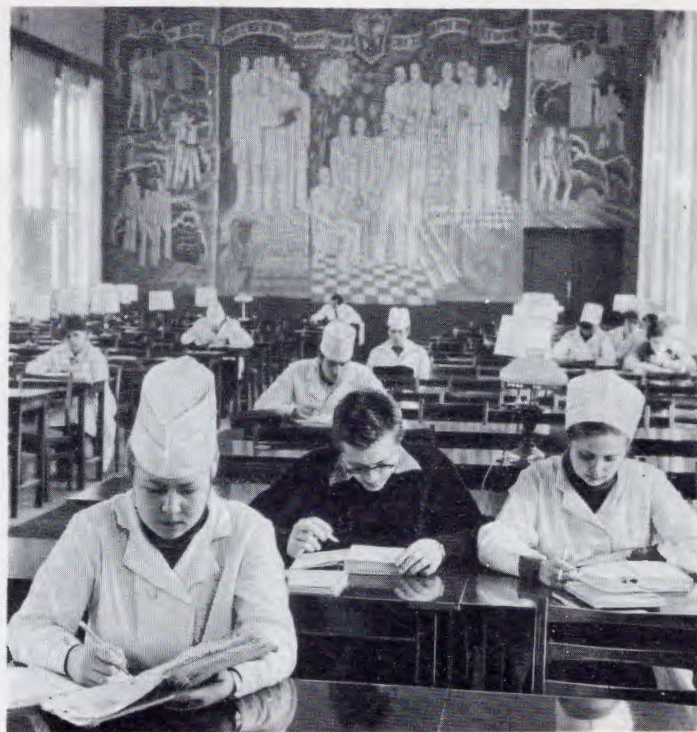
В читальном зале институтской библиотеки.

Педиатрический факультет открылся в 1961 году. Обучение завершается прохождением интернатуры по педиатрии