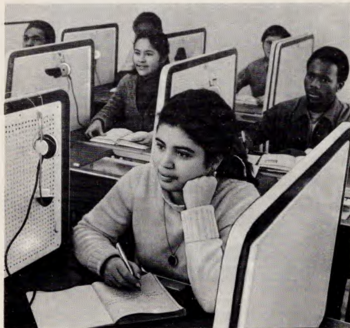
Занятия в лингафонном кабинете подготовительного факультета для иностранных граждан.

В послевоенные годы учеными института защищено 72