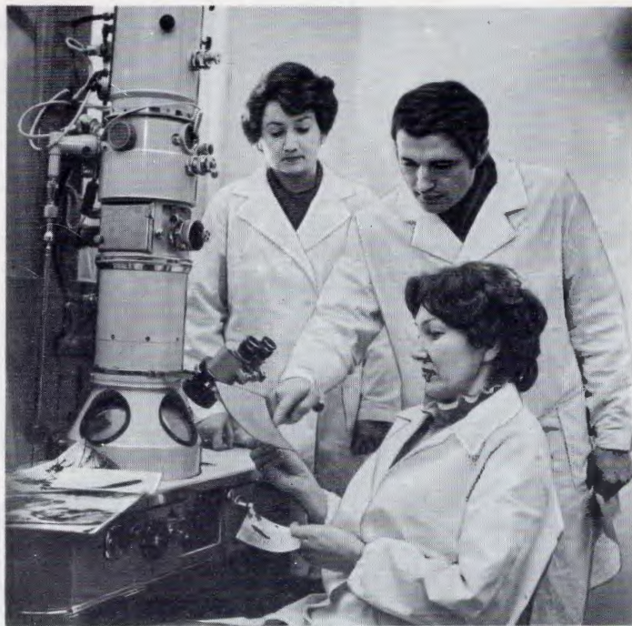
В лаборатории электронной микроскопии.