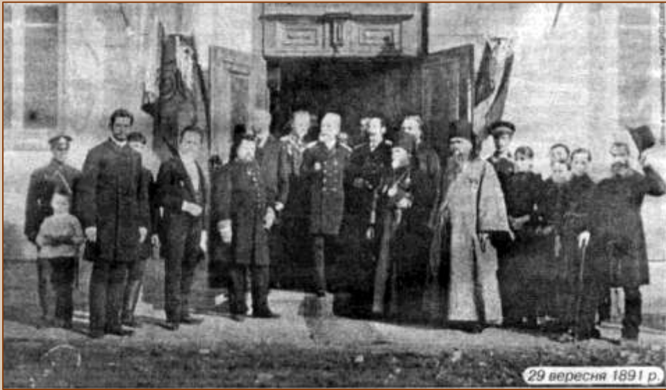
(на фото – Й. Ролле другий зліва)

Лікар-психіатр за фахом, Ролле написав багато праць з медицини, в яких висвітлював найактуальніші питання поліпшення гігієнічного стану міста, боротьби з епідеміями дифтерії, холери, скарлатини. Писав польською та російською мовами. Авторитет Ролле як фахівця з санітарії та гігієни був настільки незаперечним, що його часто запрошували читати лекції у навчальні заклади. Згодом його лекції були опубліковані окремою книгою «Популярна гігієна. Курс лекцій, прочитаних в православній духовній семінарії» (1879, 1880).