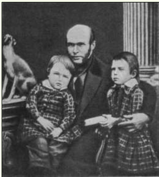
Пирогов з дітьми