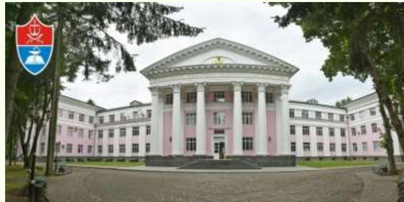
ВНМУ ім. М. І. Пирогова

Пам'ять про великого лікаря вшановується в багатьох країнах світу . На його честь споруджено багато пам'ятників, названо освітні та медичні заклади, вулиці великих міст. Його твори надихають навіть сучасних лікарів. З його іменем асоціюється ціла епоха лікарської діяльності.