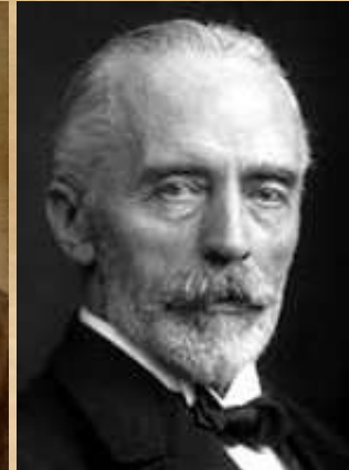
Кохер Т. (1841-1917)