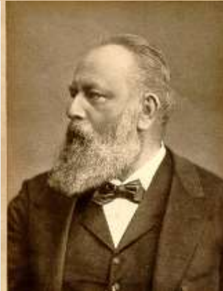
Більрот Т. (1829-1894)