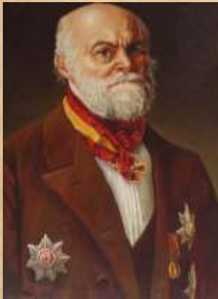
Пирогов М. І. (1810-1881)

Хірургія – найдавніша галузь медицини. Початкові основи хірургії були закладені лікарями Стародавньої Індії, Єгипту, Китаю, Греції, Риму. З роками вона розвивалася, удосконалювалася і перетворилася на справжню науку, яка займає одне з чільних місць серед інших медичних дисциплін. Велична історія хірургії рясніє іменами багатьох видатних вчених-хірургів, які зробили вагомий внесок в організацію і розвиток теоретичної та практичної хірургії. Сектор рідкісних книг і рукописів бібліотеки презентує праці великих хірургів ХІХ ст. зі скарбниці світової хірургії.