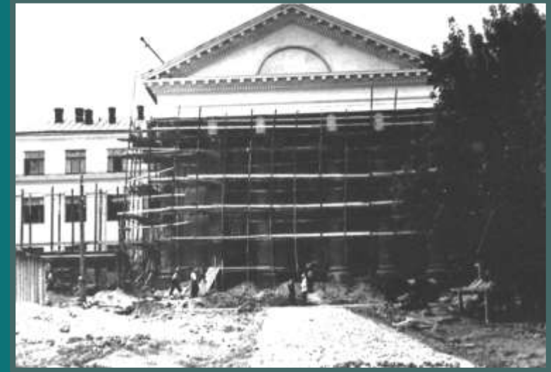
Вінницький медичний інститут, відбудова морфологічного корпусу.