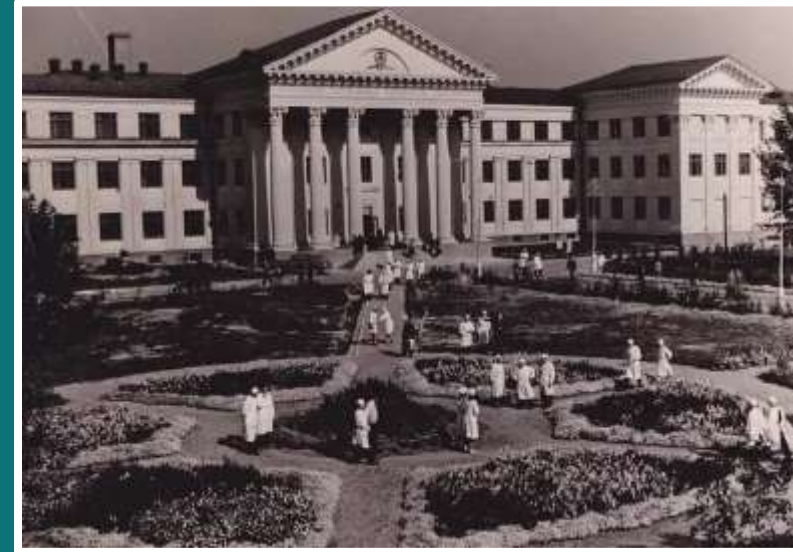
Вінницький медичний інститут. Морфологічний корпус, 50 –ті роки (фото 1), трамвайна зупинка біля медінституту (фото 2).

У 1949 р., працюючи у Вінницькому медичному інституті, почала роботу над докторською дисертацією на тему «Заболевания передней брюшной стенки после ранения и лапаротомии», яку захистила в 1952 р. в м. Одеса.