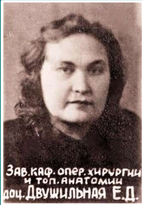
Фото з випускного альбому ВДМІ, 1952 р.