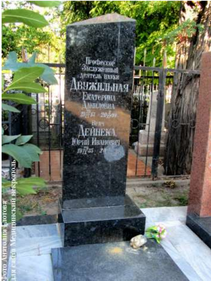
Могила Двужильної К. Д.

8 листопада 2008 р. Катерина Данилівна пішла з життя. Поховання поруч з чоловіком на 2-му Християнському кладовищі в м. Одеса.