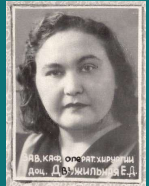
Фото з випускного альбому ВДМІ, 1951 р.