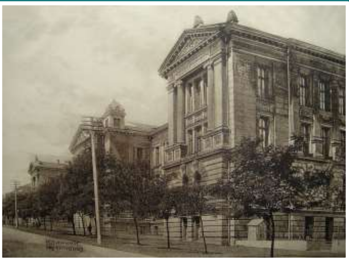
Вигляд на головний корпус медичного факультету на початку XX ст. м. Одеса