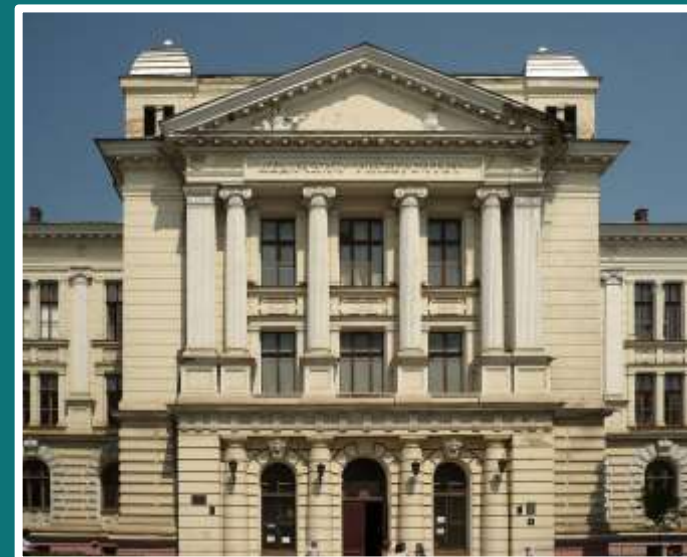
Одеський медичний університет. Головна будівля.