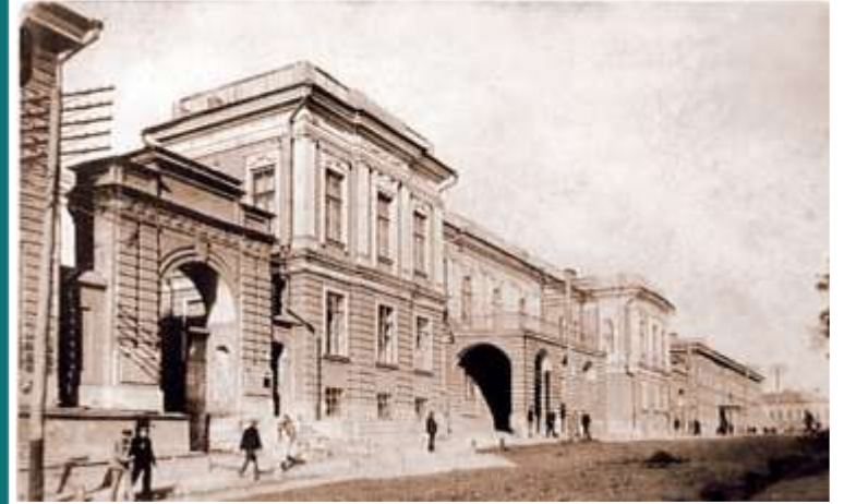
Харківський університет - старий корпус. На передньому плані одна із вхідних брам