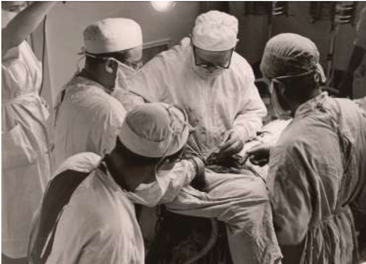
Операція на серці. Одеса