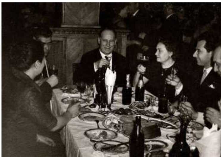
З рідними та друзями