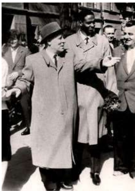
Найбільша радість – радість спілкування. Одеса, 1962 р.