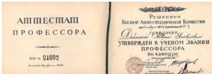
Атестат професора. 1948 р.