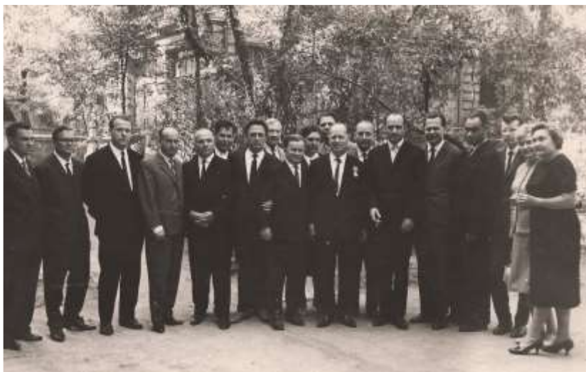
І. Я. Дейнека з учнями. 1964 р.

За свою багаторічну плідну діяльність І. Я. Дейнека був нагороджений орденом Леніна (1961), двома орденами Трудового Червоного Прапора, орденом «Знак Пошани» (1948), медалями «За перемогу над Німеччиною у Великій Вітчизняній війні 1941–1945 рр.» (1945), «За доблесну працю у Великій Вітчизняній війні 1941–1945 рр.» (1945), Почесною грамотою Верховної Ради УРСР (1964), Подяками Міністерства охорони здоров'я УРСР і СРСР. Він був удостоєний почесного звання «Заслужений діяч науки УРСР» (1957).