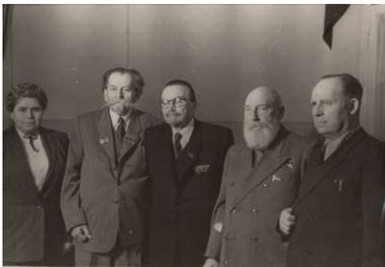
І. Я. Дейнека поруч з відомими діячами медицини. Справа наліво: І. Я. Дейнека, В. П. Філатов, О. В. Палладін, К. І. Скрябін, ?.