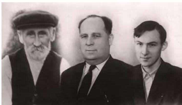
З батьком і сином