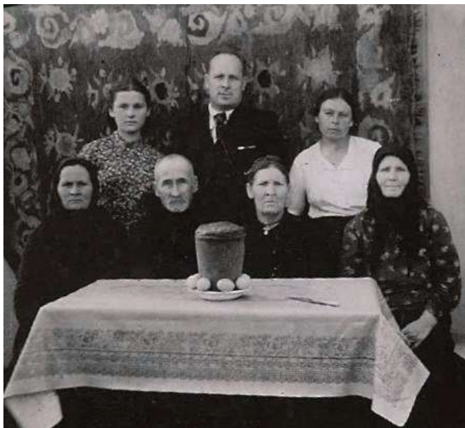
На Великдень з рідними в с. Опішня