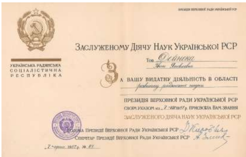
Повідчення заслуженого діяча наук Української РСР. 1957 р.