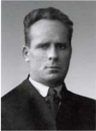
І. Я. Дейнека