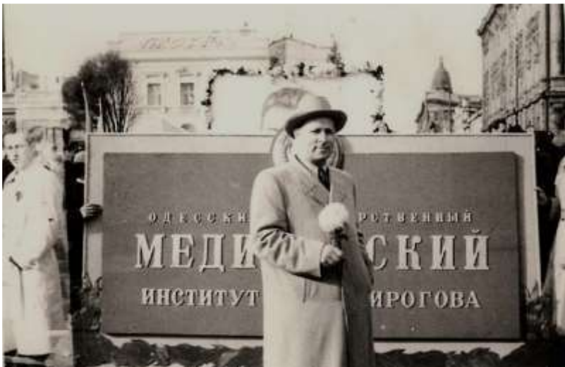
На демонстрації. Одеса, жовтень 1957 р.