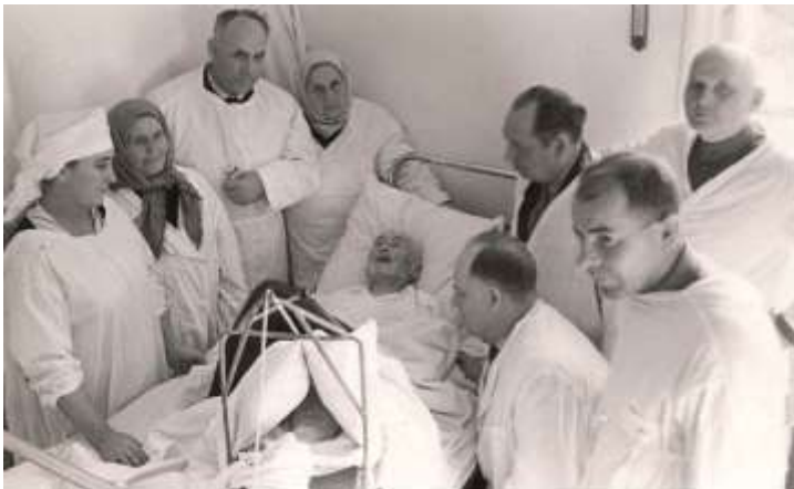
Біля хворого. с. Опішня, 18 жовтня 1963 р.