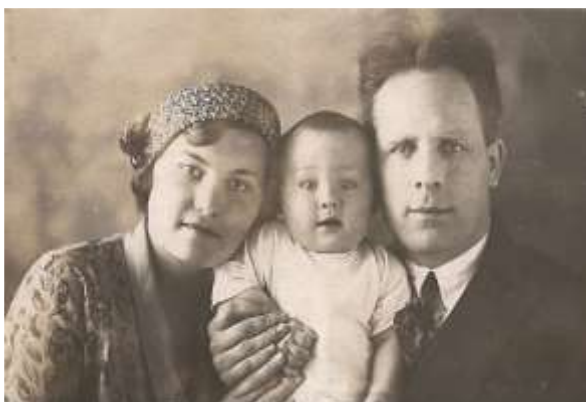
І. Я. Дейнека з дружиною та сином