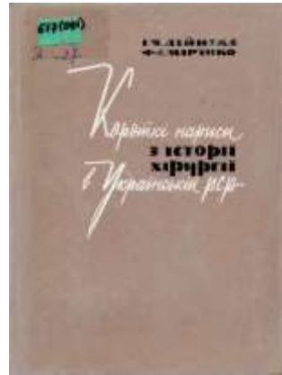
Праця «Короткі нариси з історії хірургії в Українській РСР» З фонду Наукової бібліотеки ВНМУ