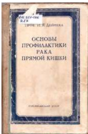
Монографія «Основы профилактики рака прямой кишки» (Київ, 1949).

У 1949 р. вийшла друком монографія І. Я. Дейнеки «Основы профилактики рака прямой кишки». Це одна з його