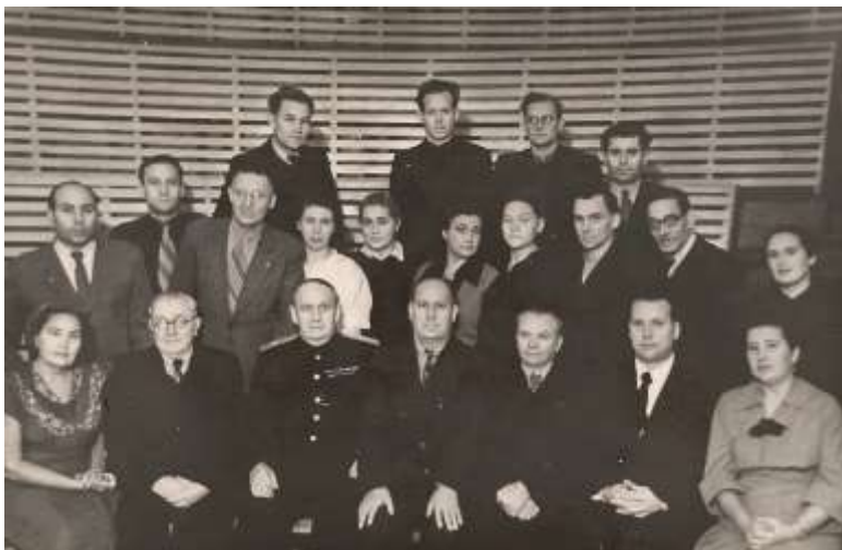
І. Я. Дейнека в першому ряду в центрі