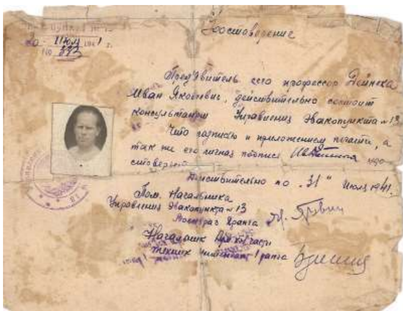
Довідка про те, що І. Я. Дейнека під час Другої світової війни служив консультантом