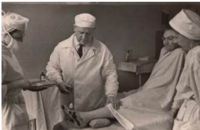
Визначення тактики лікування