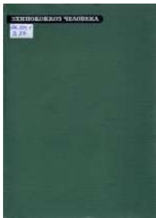
Монографія «Эхинококкоз человека» (1968).

Внесок І. Я. Дейнеки в розвиток вітчизняної хірургії вагомий. Він – автор майже 150 наукових праць, серед яких монографії, посібники, методичні рекомендації з питань передракових станів, хірургії цитовидної залози, судин, ехінококозу, ін. Під його