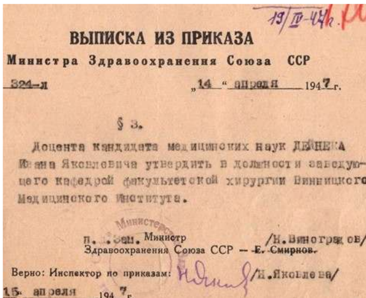
Выписка з наказу від 14 квітня 1947 р. про затвердження І. Я. Дейнеки на посаді зав. кафедри факультетської хірургії ВМІ