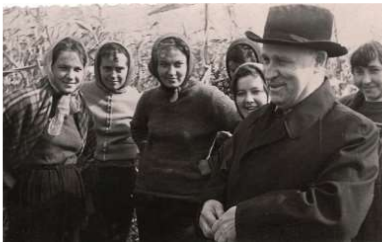
Зі студентами Одеського медичного інституту на збиранні врожаю. Одещина, жовтень 1960 р.