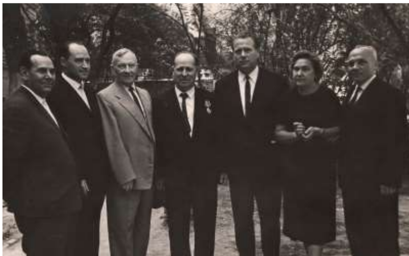
З дружиною, учнями та колегами. Вінниця