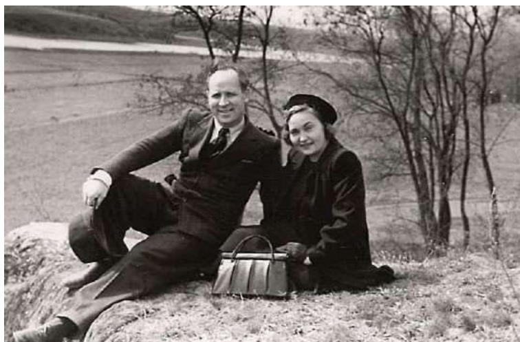
На лоні природи