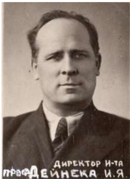
Професор І. Я. Дейнека – ректор Вінницького медичного інституту. 1949 р.