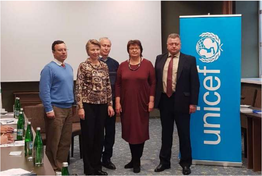
З колегами на міжнародній конференції