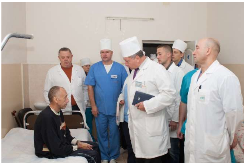
Олег Євгенійович з колегами під час обходу пацієнтів