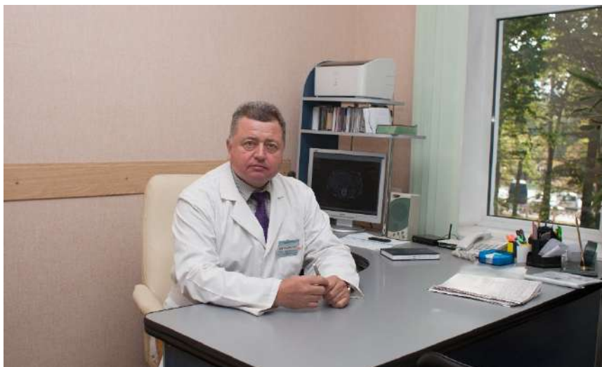
У робочому кабінеті