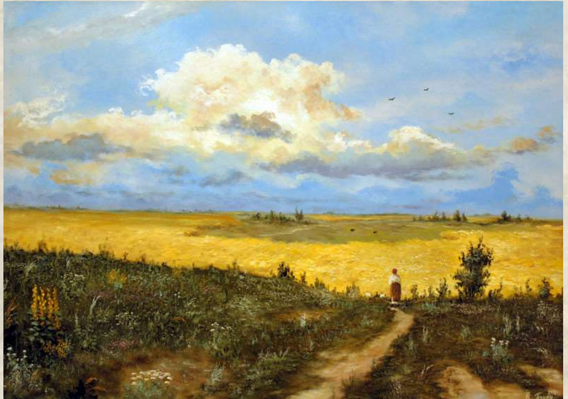
Юрій Пацан (1963). Простори рідної України

Ю. І. Пацан - український художник, кавалер ордена «За заслуги» III ступеня (2008), Заслужений художник України (2014).