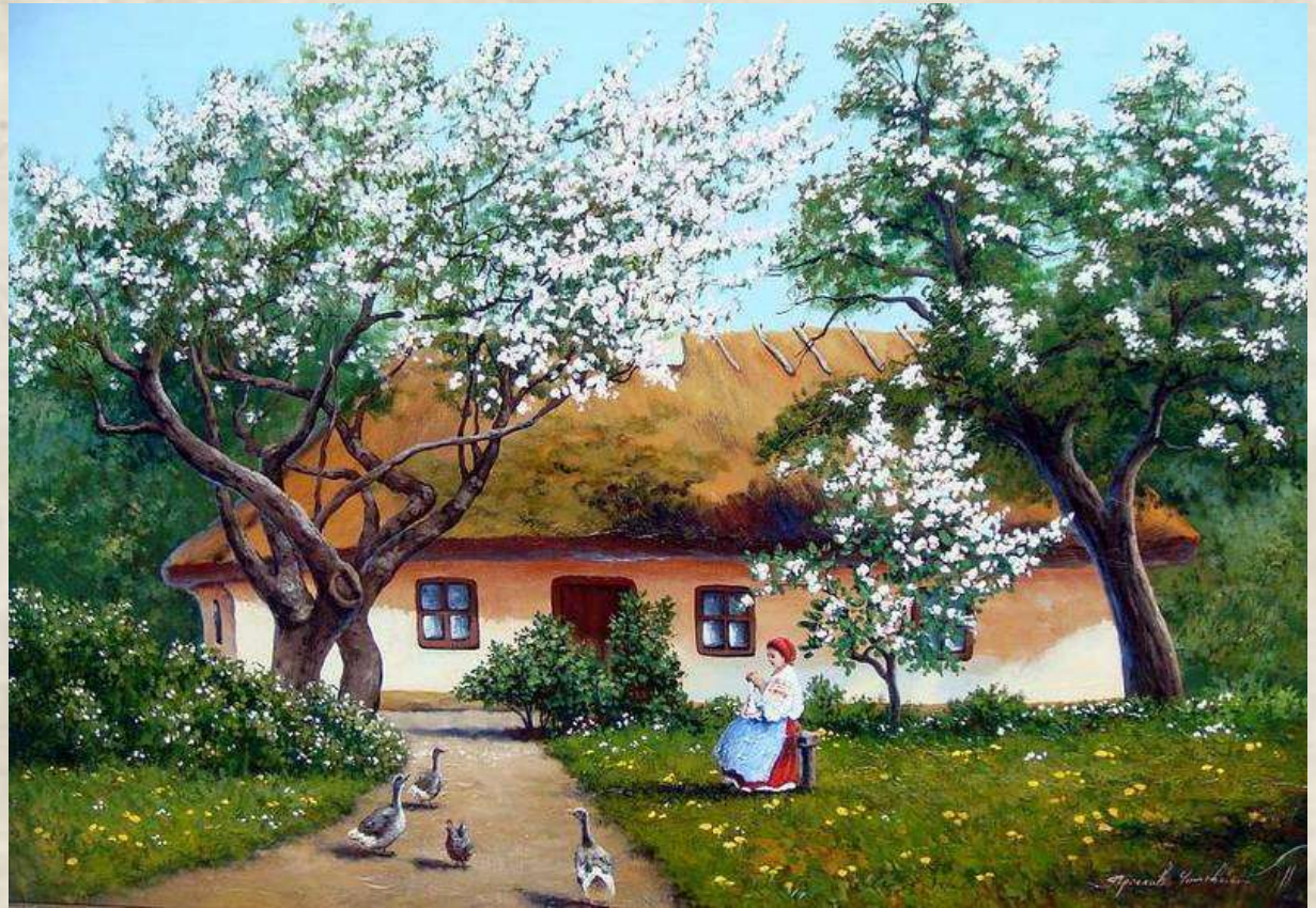
Ярослав Чижевський. «Українська хата»