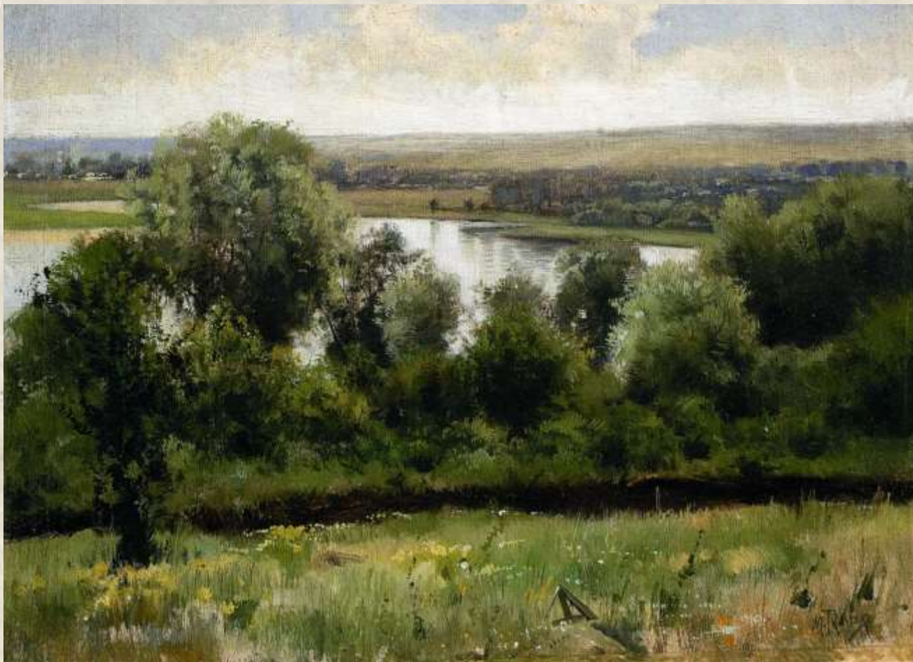
Михайло Ткаченко (1860, Харків – 1916, Слов'янськ). «Берег Сули, притоки Дніпра», 1900

М. Ткаченко - український маляр, пейзажист і мариніст. Сайт «Музей українського живопису» museum.net.ua