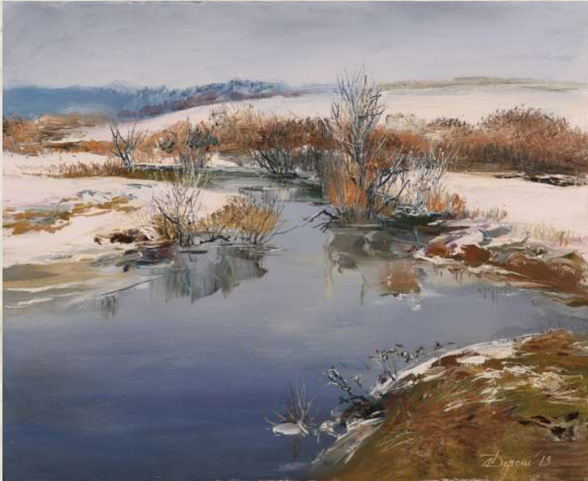
Олександр Дорошенко (1959). «Річка Ірпінь, що тече в зиму», 2019

О. Дорошенко – український живописець. Заслужений художник України (2002), член Національної спілки художників України (1992). Працює у техніці олійного живопису.