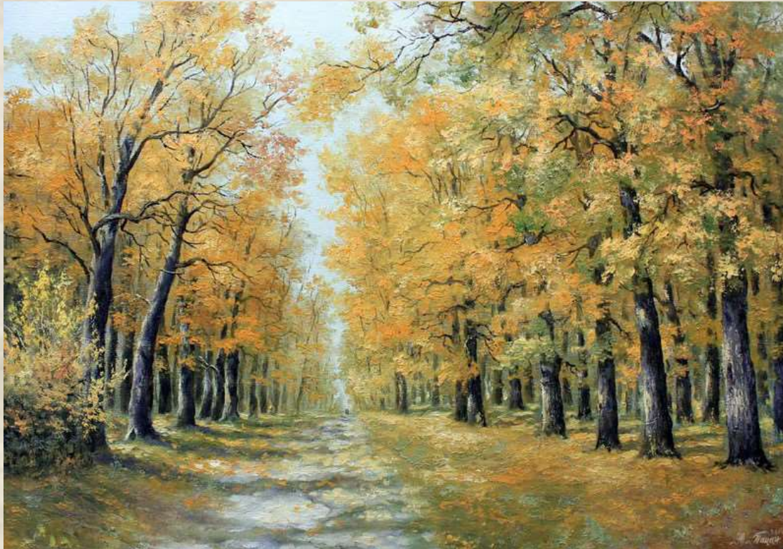
Юрій Пацан (1963). Осінь в парку.

Ю. І. Пацан - український художник, кавалер ордена «За заслуги» III ступеня (2008), Заслужений художник України (2014).